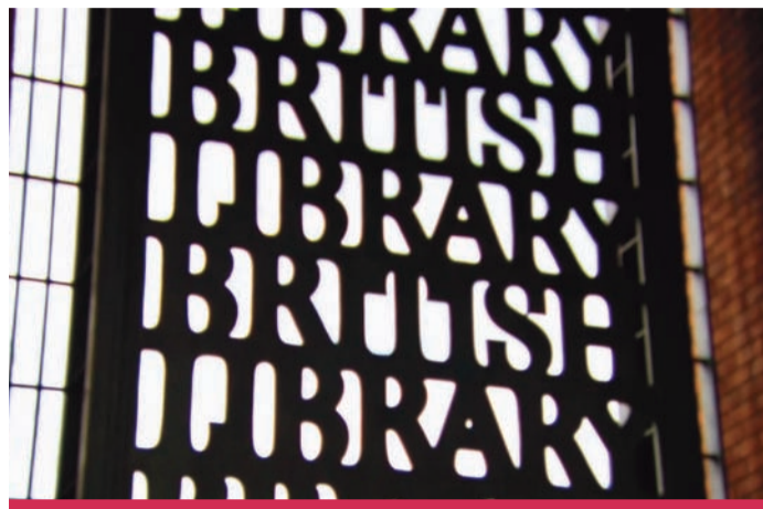
The British Library