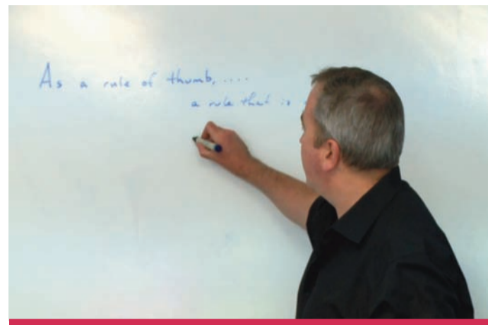
Learning more about English